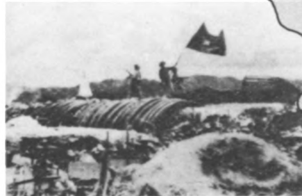
7. Mai 1954 Dien Bien Phu – Der historische Sieg über den französischen Kolonialismus