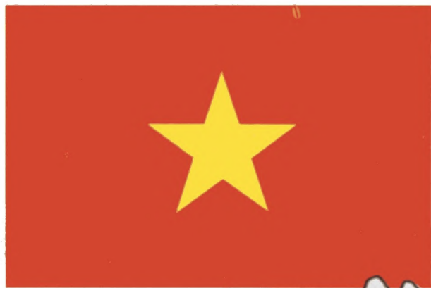
Fahne der Sozialistischen Republik Vietnam

Aus der Geschichte des vietnamesischen Volkes 53