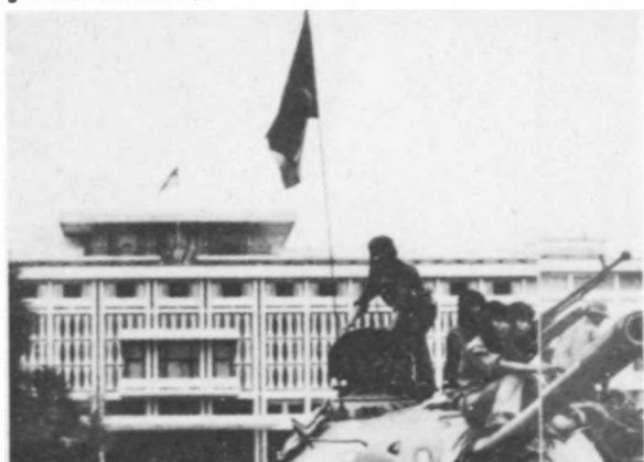
30. April 1975 – die FNL-Fahne weht vom Präsidentenpalast in Saigon – ganz Vietnam ist befreit