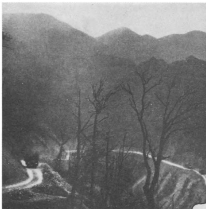
Ho Chi Minh-Pfad, Nachschubweg der Revolution