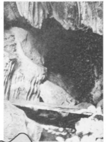
Die Grotte Coc Bo, das Yanan der vietnamesischen Revolution