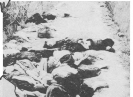
Massaker des US-Imperialismus in My Lai 1968